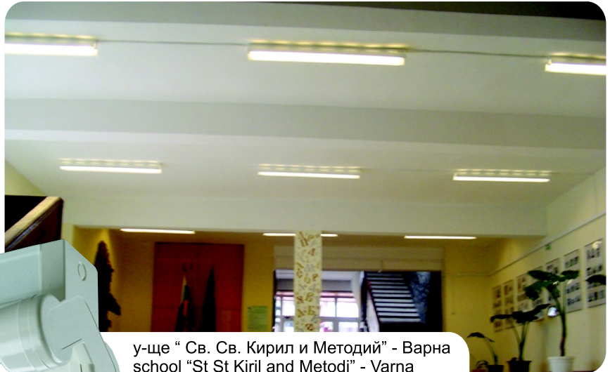
у-ще "Св. Св. Кирил и Методий" - Варна school "St St Kiril and Metodi" - Varna