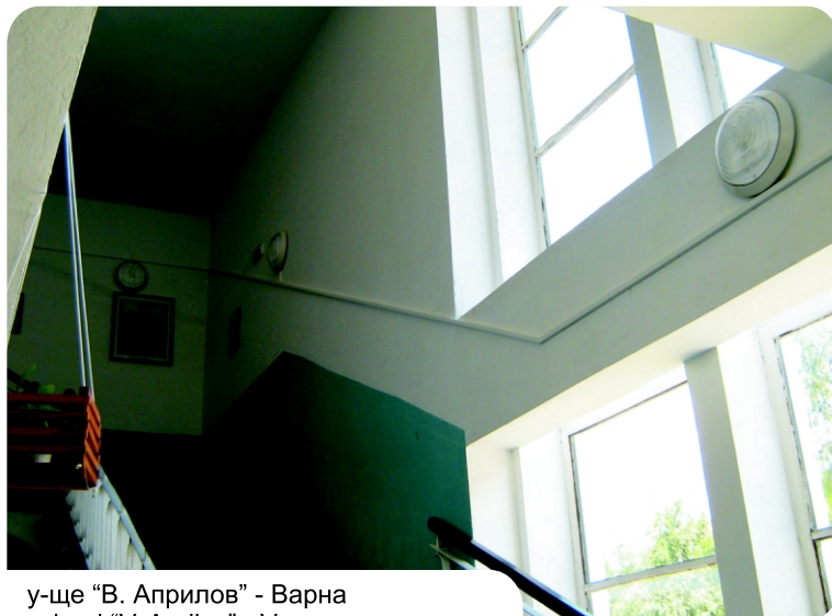
у-ще "В. Априлов" - Варна school "V. Aprilov" - Varna