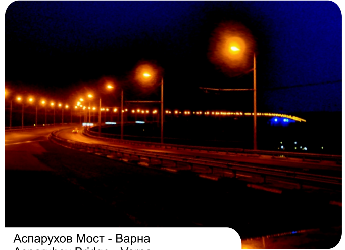
Аспарухов Мост - Варна Asparuhov Bridge - Varna